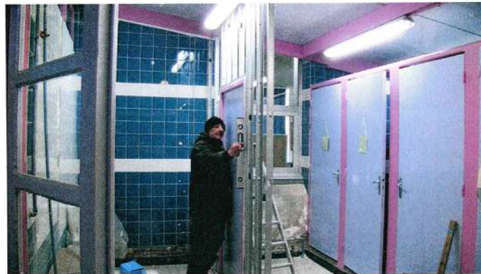
Rénovation des sanitaires de l'école élémentaire Maurice CAREME